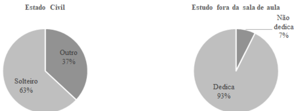
Figura 3 - Estado civil e estudo fora da sala de aula

No tocante à predominância do estado civil dos discentes que compuseram a amostra, 63 % informaram estarem solteiros, enquanto 37 % declararam outro estado civil. Outra característica descritiva da amostra evidenciou que 93 % dos estudantes se dedicaram aos estudos, excetuando as horas em aula, em pelo menos uma hora por semana, enquanto 7 % informaram não se dedicarem. A Figura 3 apresenta estes resultados.