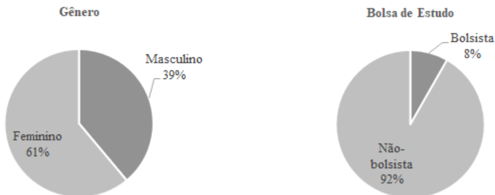
Figura 2 - Gênero e bolsa de estudo

No tocante à predominância do estado civil dos discentes que compuseram a amostra, 63 % informaram estarem solteiros, enquanto 37 % declararam outro estado civil. Outra característica descritiva da amostra evidenciou que 93 % dos estudantes se dedicaram aos estudos, excetuando as horas em aula, em pelo menos uma hora por semana, enquanto 7 % informaram não se dedicarem. A Figura 3 apresenta estes resultados.